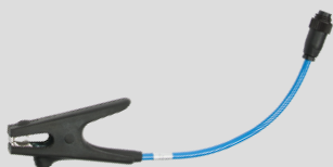
Aardingsstang set CB1 Big Bag